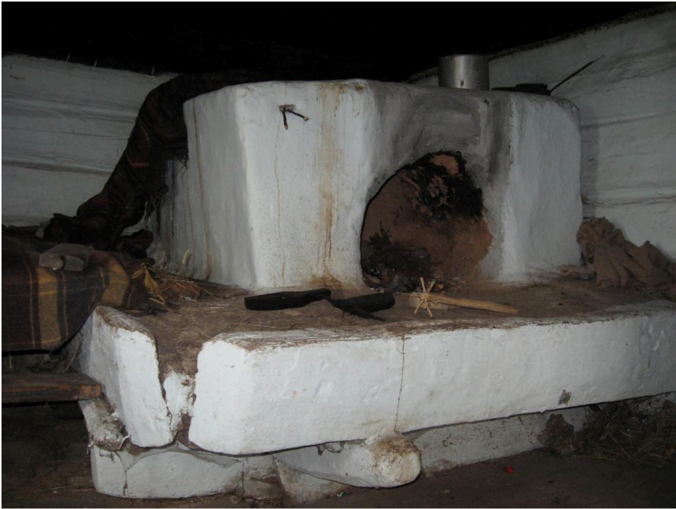
Фото 9. Курна піч в інтер'єрі хати 1867 року. Село Суходіл (урочище Бездежа) Рожнятівського району Івано-Франківської області. Фото Р.В. Дубини. 2008 р.

Дим із курної печі виходив у відчинені двері та в отвір у стелі – «вікно в повалі». Узимку внизу двері завішували веретою, щоб до хати не йшов холод. Відчиненими двері тримали доти, доки піч куріла [4, арк. 18].