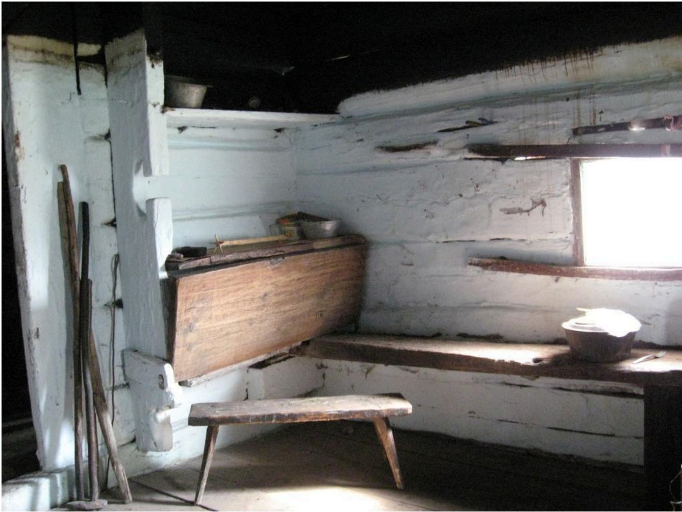
Фото 12. Фрагмент інтер'єру курної хати 1867 року (мисник, лава, «столець», «волокове» вікно, у кутку – коцюби, коромисло). Село Суходіл (урочище Бездежа) Рожнятівського району Івано-Франківської області. 2008 р.

Через нестачу якісної глини гончарство на Східній Бойківщині не набуло значного поширення. Одним із небагатьох центрів цього ремесла було місто Болехів Рожнятівського району Івано-Франківської області. Тому в побуті місцевих жителів керамічних виробів до початку ХХ ст. було небагато. Посуд був як полив'яний, так і чорнолощений, орнаментований. Часто гончарні вироби слугували прикрасою інтер'єру, особливо фаянсові та глиняні «миси» (миски). Посудини великих розмірів для міцності, як і всюди в Україні, перетягували дротом – дротували.