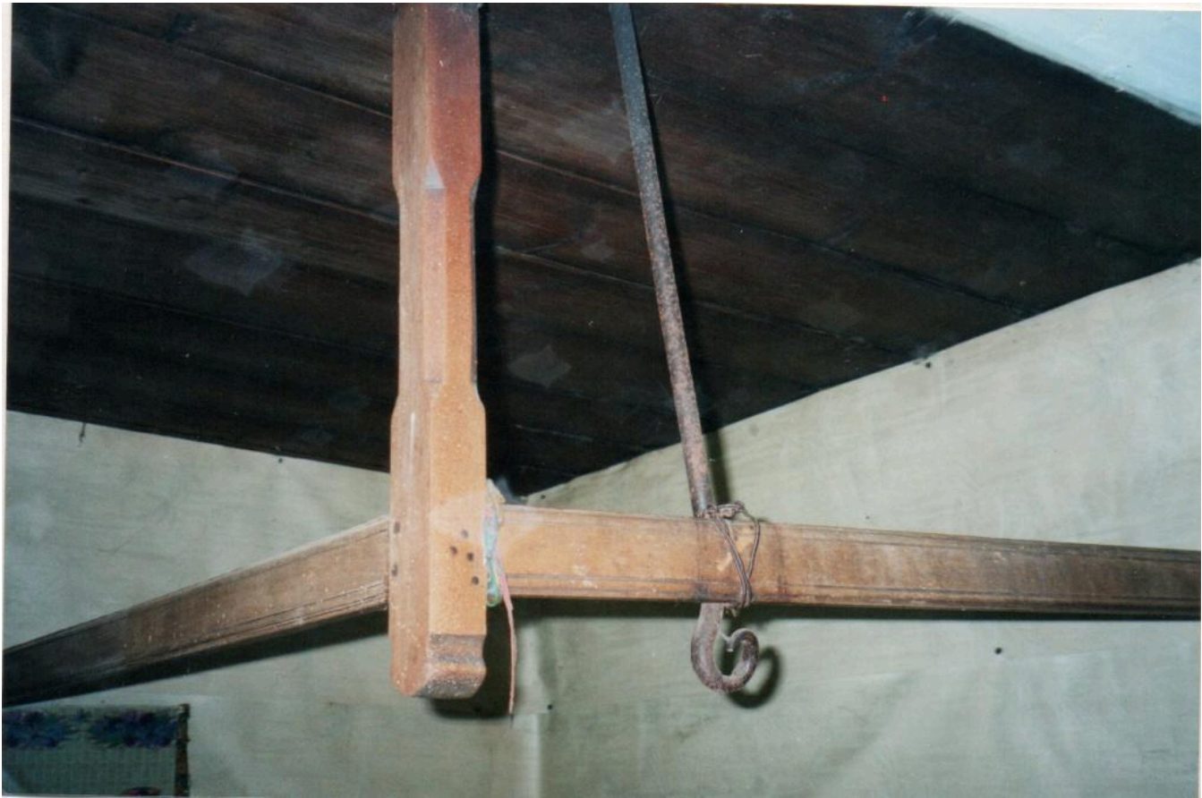
Фото 11. Жердка, «ключка» для колиски в інтер'єрі хати із села Липовиця Рожнятівського району Івано-Франківської області. 2010 р.

До жіночого натільного одягу відносилась «куживна, зрібна сорочка; на плечах – вуставки, а на рукавах – дуди (манжети), а внизу – обшивка». [4, арк. 22]. Поясним одягом у кінці ХІХ – на початку ХХ ст. була спідниця, поверх якої одягали «півку» (фартух), підперізувались крайкою. Голову запинали хусткою.