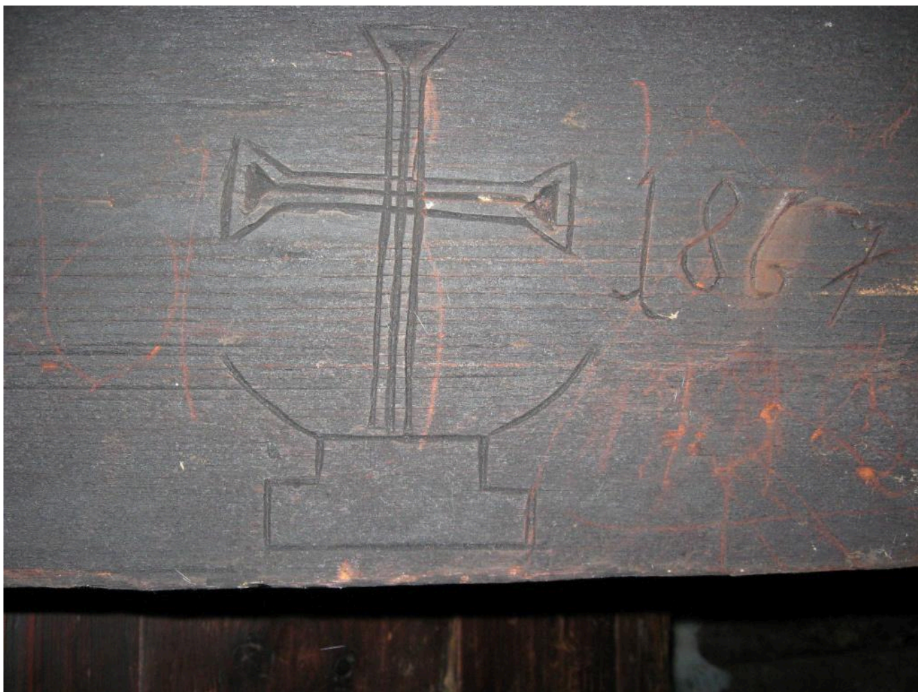
Фото 7. Одвірок із вирізьбленим хрестом і датою будівництва хати. Село Суходіл (урочище Бездежа) Рожнятівського району Івано-Франківської області. Фото Р.В. Дубини. 2008 р.

Слід зазначити, що бойківська архітектура майже позбавлена всяких прикрас. Лише одвірок хатніх дверей та сволок оздоблювались декоративною різьбою. Орнаментальні мотиви, різні за тематикою та складністю виконання, мали, як правило, символічне значення й виконували роль оберегів. Найпоширенішими серед них були хрест різних форм та величин і кола з пелюстками (розети). Нерідко вирізьблювали ім'я господаря, дату будівництва житла (фото 7).