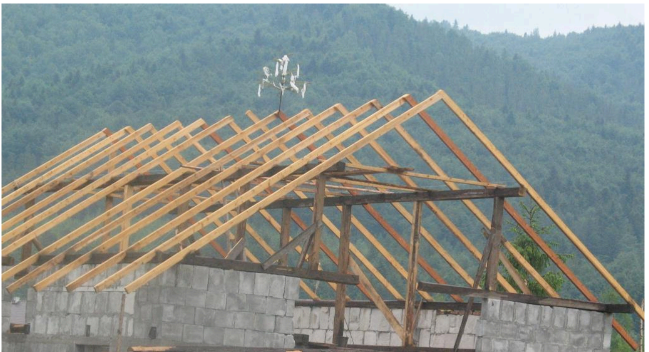
Фото 5. «Віха». Село Луги Рожнятівського району Івано-Франківської області. 2008 р.

Робота теслів закінчувалася встановленням ними на кроквах «віхи» або «квітки» – молодій смерічки, прикрашеної стрічками та квітами з паперу (фото 5). Господиня закидала на дах сорочку, яку діставав старший майстер і забирав собі. Установлення віхи завжди відмічали піснями та гостиною [4, арк. 14].