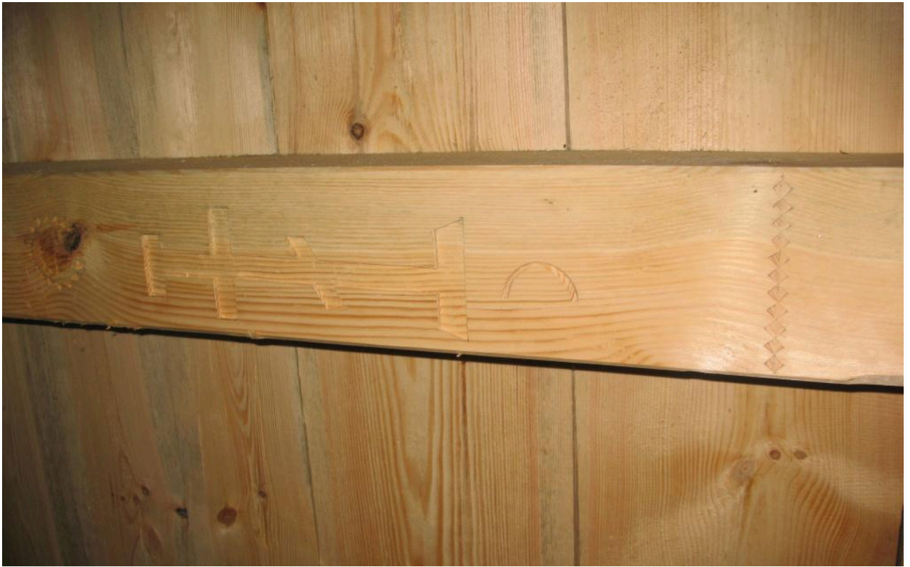
Фото 3. Різьблений сволок в інтер'єрі хати із села Липовиця Рожнятівського району Івано-Франківської області. НМНАПУ. Фото Р.В. Дубини. 2010 р.

Під час зведення стін у спеціально вирубані гнізда у двох верхніх вінцях зрубу клали сволок – «грагар» (фото 3). Поверх нього з грубих дощок лаштували стелю – «повал». У центрі стелі біля сволока робили отвір (30×40 см), що закривався дощечкою й призначався для випускання диму з печі – «вікно в повалі» (фото 4). Над сіньми стелі не влаштовували з міркувань кращої вентиляції всієї будівлі.