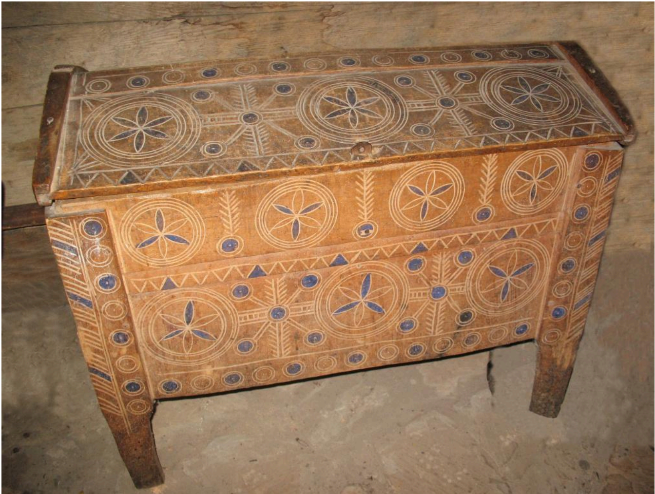
Фото 13. Скриня початку ХХ ст. із села Ясень Рожнятівського району Івано-Франківської області. НМНАПУ. 2009 р.

рушники, верети, сувої чистого полотна тощо. Крім того, тут була й пляшечка зі свяченою водою.