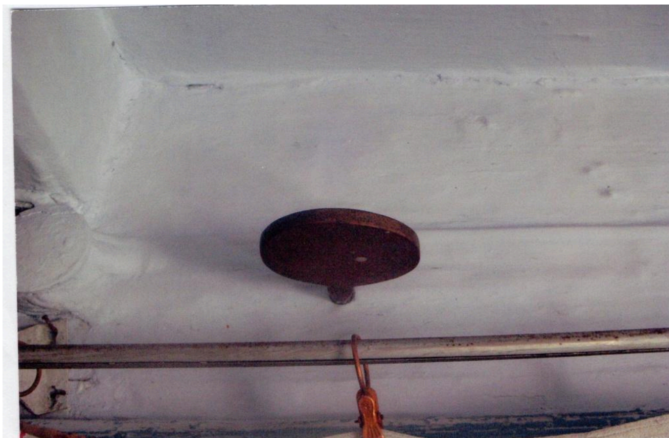
Фото 8. «Кружечок» на стіні в інтер'єрі хати із села Липовиця Рожнятівського району Івано-Франківської області. 2008 р.

У сінешній, чільній, причілковій та тильній стінах житлового приміщення, заздалегідь робили свердлом отвори «наохрест», в які священник закладав «кусочок писанія» (фрагмент сторінки з Євангелія) і закривав «кружечком» – круглою дощечкою, діаметром 5–7 см з тибликом (кілочком) на торці, який і входив у висвердлений отвір (фото 8). Під час освячення на кожен кружечок ставили запалену свічку й клали «калачик» [4, арк. 16].