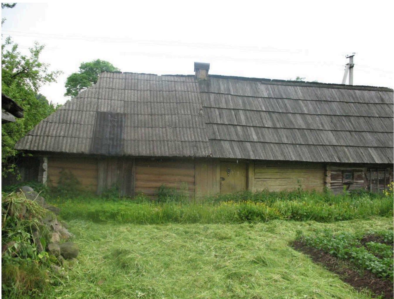
Фото 2. «Довга хата» в селі Луги Рожнятівського району Івано-Франківської області. Фото Л.А. Главацької. 2007 р.

зручністю, практичністю та економією будівельного матеріалу й площі земельної ділянки. Слід зауважити, що й перевезену до Музею хату також можна віднести до типу «довгої хати»: хата + сіни + комора + стайня для овець («вівчарня») [6, арк. 2]. Праворуч уздовж причілкової стіни влаштовано великий винос даху, під яким ставили воза або сани.