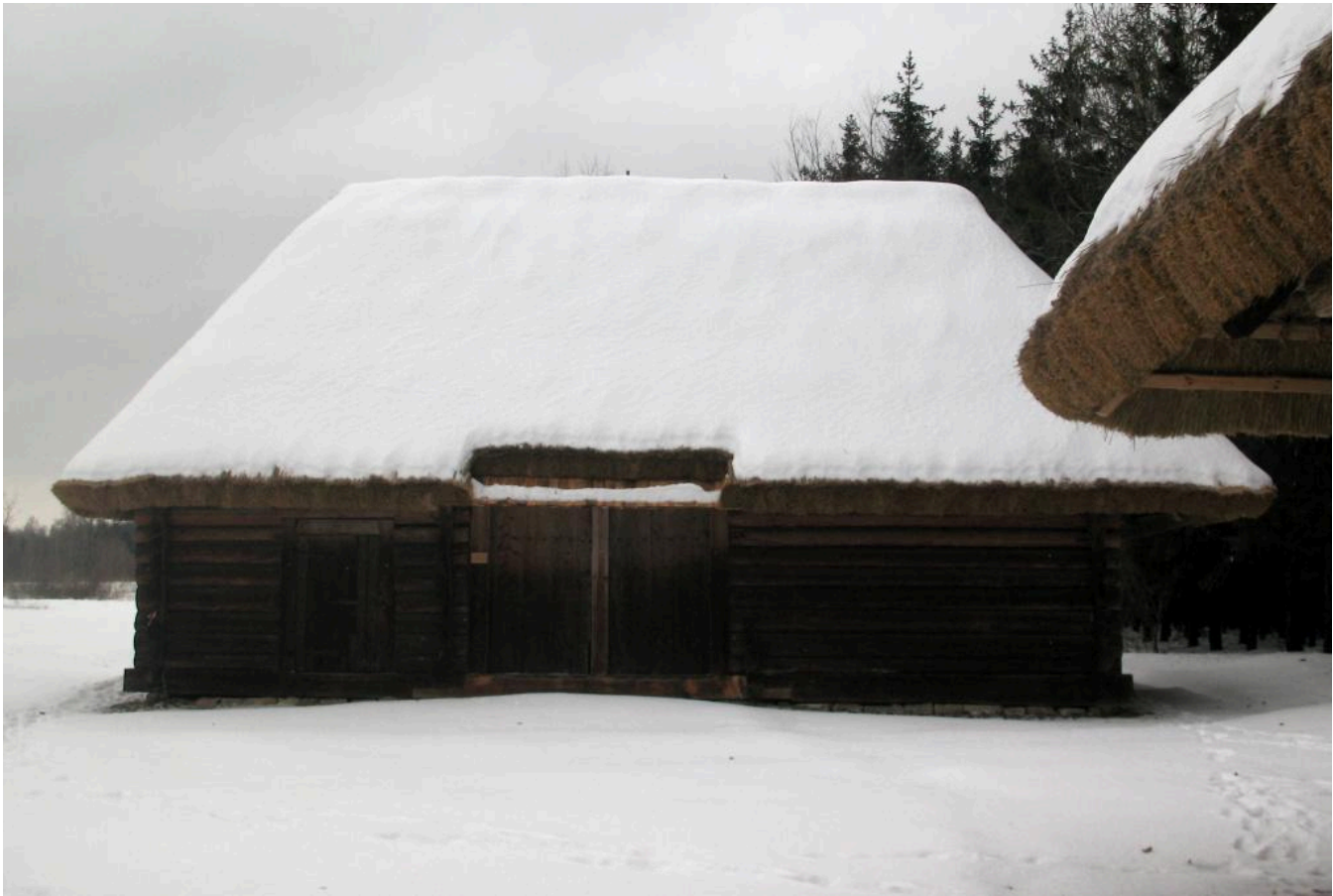
Фото 14. Стодола із села Небилів Рожнятівського району Івано-Франківської області. НМНАПУ. Фото Р.В. Дубини. 2010 р.

У плані споруда дводільна – стодола + стайня. У стодолі зберігали збіжжя в снопах, упряж, коси, серпи тощо. Обмолочували снопи ціпами всередині стодоли на току. У стайні (хліві) тримали коней, корів, телят. Уздовж стін облаштували ясла та жолоби, в які закладали тваринам їжу.