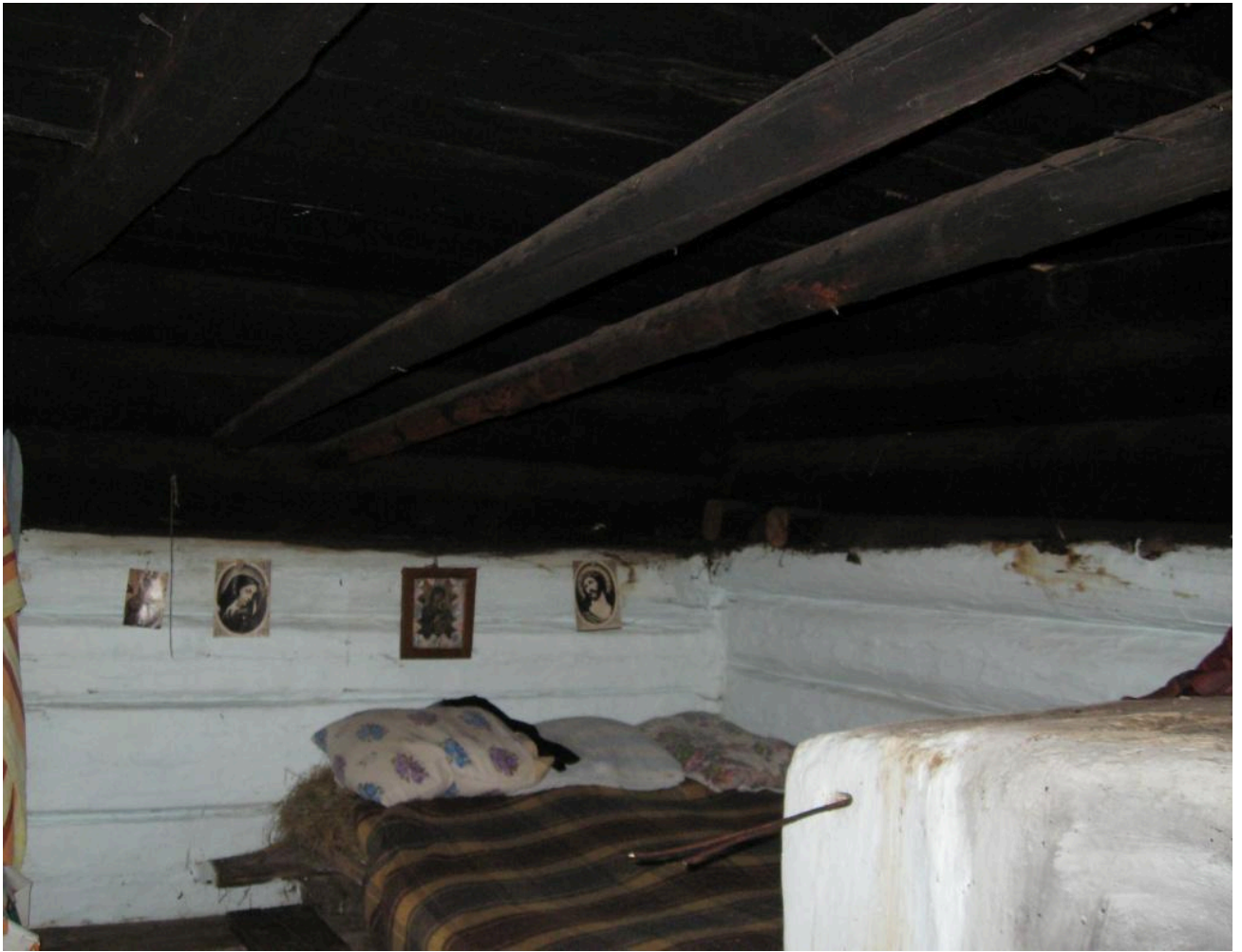
Фото 10. Фрагмент інтер'єру курної хати 1867 року («постіль», «греди», скіпки для освітлення). Село Суходіл (урочище Бездежа) Рожнятівського району Івано-Франківської області. 2008 р.

Для влаштування полу закопували чотири дерев'яні стовпчики – «ковбани». З'єднували їх попарно дерев'яними брусками й настеляли колоті смерекові дошки.