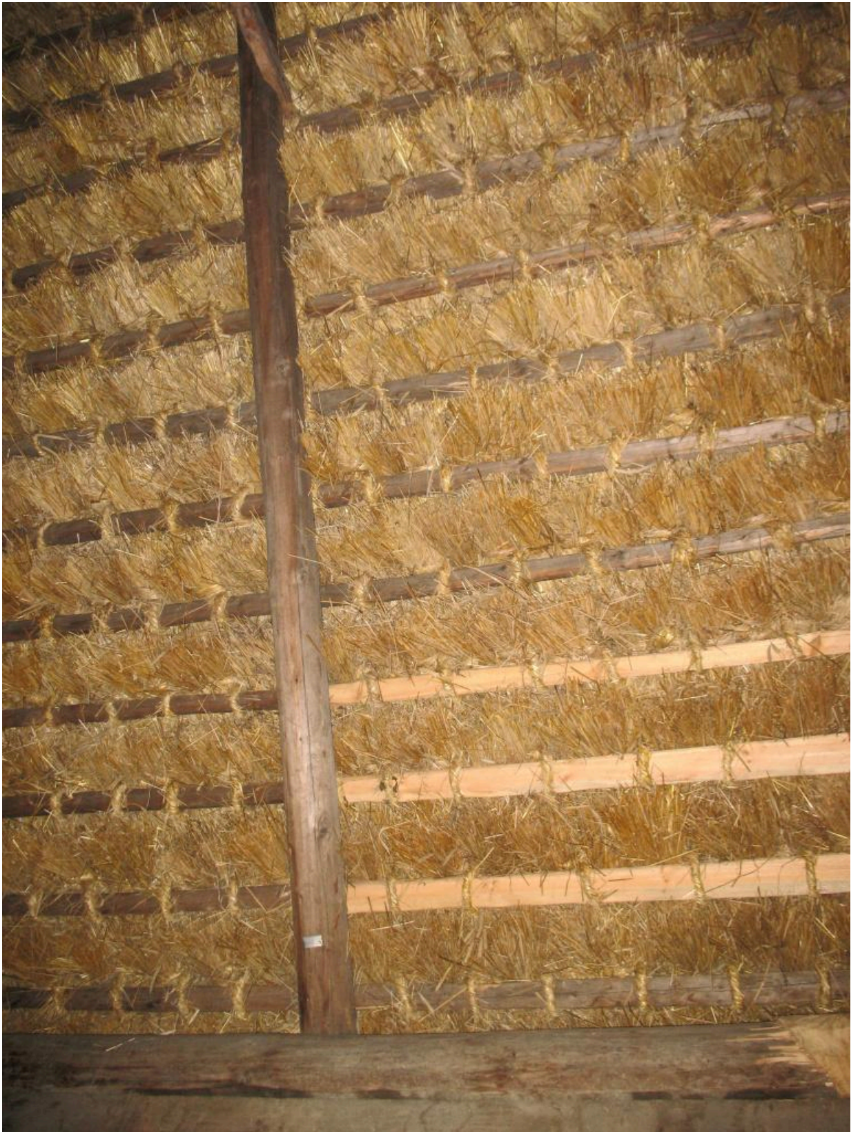
Фото 6. Солом'яна покрівля даху. Вид із сінєй хати із села Липовиця Рожнятівського району Івано-Франківської області. НМНАПУ. 2010 р.