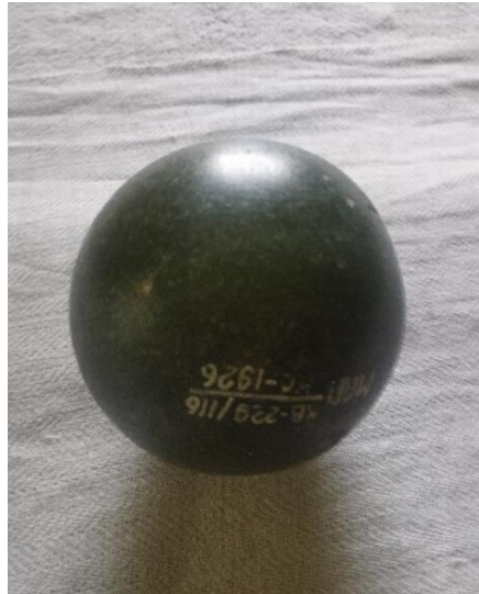
Іл. 4. Гало – кам'яна куля для розгладжування серпанку. Поч. ХХ ст. З фондів НМНАПУ

та не дуже широкого (60–70 см) полотнища, майже завше білого і тільки з часом, у дуже старих жінок, темно-димної барви; прасують намітку не праскою, а галом, кам'яною або скляною кулею. Для цього дві жінки тримають намітку за кінці та котять по ній гало» (іл. 4) [5, с. 134].