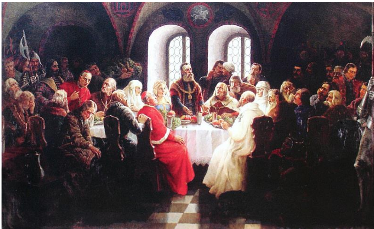
Іл. 8. «Європейський конгрес монархів у Луцьку у 1429 р.». На полотні Йонаса Мацкявічуса (1934 р.) зображені дві волинянки в серпанках

Отже, у циклі роботи з льоном ми розглянули основні технологічні етапи від сівби до виготовлення білосніжного, прозорого серпанку й підготовки його до пошиву одягу чи для інших ритуалів. От і весь секрет. А носіями серпанкового ткацтва до сьогодні є майстрині із с. Крупове, які не лише зберегли технологію його створення, але й популяризують і передають прийдешньому поколінню це унікальне й корисне ремесло (іл. 9). Вони ще б і зараз ткали на своїх кроснах, але, на жаль, їхні куфри опустіли через відсутність сировини. А міг би найтоншу нитку виготовляти будь-який льонозавод на Рівненщині, адже до 1992 року льонарство було провідною галуззю сільського господарства Полісся. В Україні на той час щорічно льоном засівали 230–240 тис. гектарів. Україна посідала друге місце за посівами серед країн Європи і Азії [13, с. 278], у нас діяло більше 46 льонозаводів загальною потужністю виробництва 130 тис. тонн волокна на рік. У м. Рівному працював найбільший льонозавод, а ще в м. Дубровиці, с-щі Зарічне, м. Сарнах. Усі заводи приведені до банкрутства або перепрофільовані, адже на початку ХХІ ст. вже не було чого переробляти. Посівна площа льону-довгунця у 2013 році, порівняно з 2005 роком, зменшилася на 96 % і становила 1 тис. гектарів [8, с. 14].