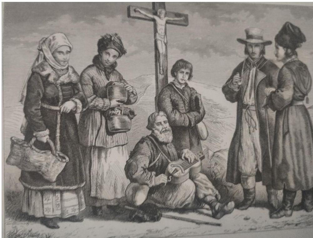
Іл. 3. Селянка в серпанку із с. Скалата на Тернопільщині (Східна Галичина). Кін. XIX ст.

Визначний етнограф Ф. Вовк зауважував, що «в Україні ми бачимо серпанок на всіх малюнках, починаючи з Ізборніка Святослава. І це вкриття переходить через цілу історію України, переходується в козацьку добу, доходить і до наших часів. Проте сучасна намітка (а це поч. XX ст.) в багатьох місцевостях України зникла або зникає («баби побрали на той світ» [тобто поховали в намітці. – Т. В. ])» [5, с. 134]. Водночас те саме повідомляє і Л. Падалка: «...намітка, старовинний головний убір з тонкої лляної тканини літніх жінок, довжиною в 3 аршини і шириною \frac{3}{4} аршина, яка пов'язувалася навколо голови і спускалася кінцями не менше аршина на спину, зникає повсюдно в Переяславському, Прилуцькому, Роменському, Лохвицькому, Гадяцькому, Хорольському і Золотоніському повітах, а в деяких місцях не побачиш у церкві навіть на великі свята. Лише в Роменському повіті намітка ще використовується для накриття покійниць» [22, с. 37].