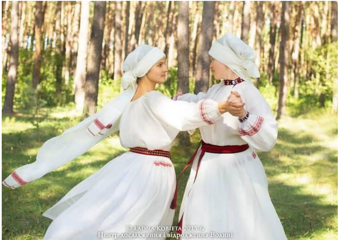
Іл. 10. Відроджений серпанок. ГО «Центр дослідження і відродження Волині». м. Радивилів Рівненської обл.

український серпанок стане надбанням тільки історії як загадкова тканина – єгипетський серпанок, чистий і світлий вісон, що був притаманний лише найвищій касті, який відійшов у минуле разом із рабовласницьким суспільством, але залишив насамперед «духовно-образний одяг», що проходить через усю Біблію як символ праведних справ і моральної чистоти.