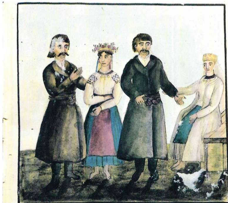
Мешканці Тарашанського товариства

Іл. 2 а, б. Мешканці сіл різних громад Київської губернії. 1854 р. З альбому Де ля Фліза