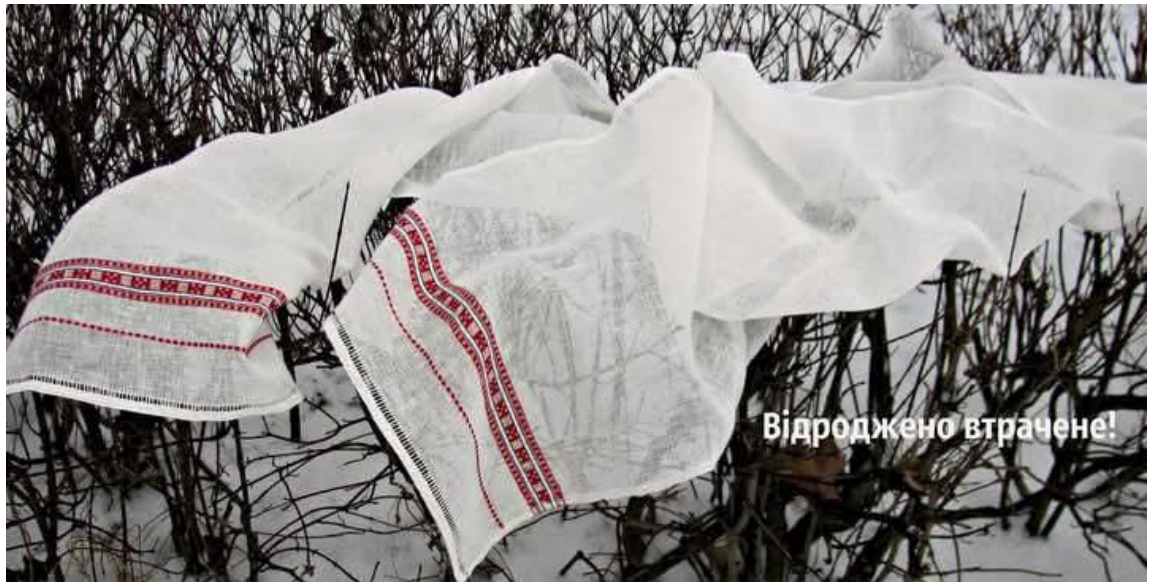
Іл. 7. Намітка серпанкова. ГО «Центр дослідження і відродження Волині». м. Радивилів Рівненської обл.

Завершальним циклом робіт із підготовки тканини був процес вибілювання готового полотна. З вибілюванням поєднувалося зоління. Для цього брали попіл із гречаної соломи, соняшників, гороху, березової кори тощо. З попелу виготовляли луг. Для зоління використовували жлукто – видовбану колоду без дна, яку ставили на землю, підстеливши соломі, або в ночви. Закладали в жлукто полотно, заливали його гарячим лугом чи клали гарячий камінь [7, с. 157]. Після цього полотно замочували у воді, били праником біля криниці, на луках, біля річки. Полотно довго білили на сонці в мороз і спеку. Найсприятливішим часом для вибілювання домотканого полотна був липень. Через це навіть місяць липень називали в народі «білень». Говорили: «Більня добре полотно си білить» [24, с. 674]. Після вибілювання серпанкове полотно крохмалили й розтягували до прозорого стану – катали скляними ядрами чи круглими каменями (гало), про які зазначав Ф. Вовк, доки полотно не набувало сріблястого полиску і добре не просвічувалося. Потім його скручували в сувої та ховали в скрині. Тепер серпанкове полотно готове для пошиття одягу, наміток або для інших ритуалів. Про кінцевий результат тривалого трудового процесу в народі казали: «В умілих руках виріб грає, як сонце».