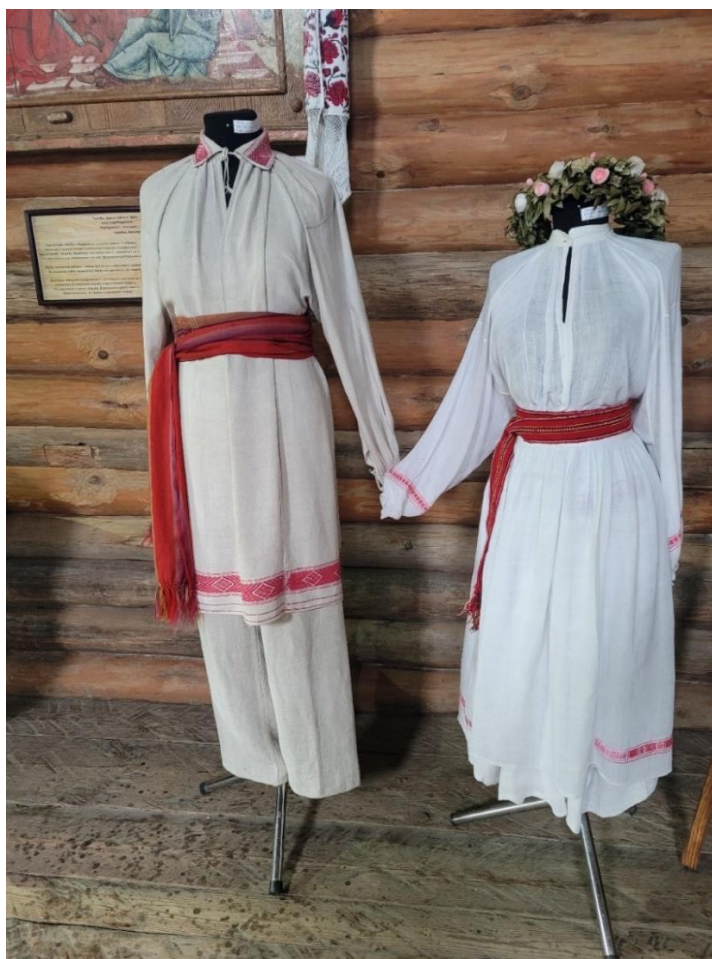
Іл. 5. Стародавній серпанковий весільний стрій. Рівненщина. Поч. XX ст. З фондів НМНАПУ

XX ст. у кожній поліській оселі можна було побачити ткацький верстат і прядку («кужілки», «потаси», «лопатні» – місцеві назви прядок) [19, с. 91–92]. У багатьох селах Рівненського Полісся ткали дуже тонке, аж прозоре полотно, яке називали «серпанком», з нього шили весільне вбрання (іл. 5), сорочки, спідниці, фартухи, намітки. Найдовше традиція ткацтва серпанку збереглася у с. Крупове та навколишніх селах Дубровицького району [20, с. 35]. Село Крупове досі залишається центром відродження й побутування поліського серпанку. Тут місцеві майстрині зберігали і відроджували особливості ручного серпанкового ткацтва. Щоб зробити цю унікальну, прозору тканину, треба було виконати дуже довгий технологічний ланцюг робіт. І від послідовного вчасного виконання кожного виробничого етапу залежала якість тканини. Технологія виготовлення полотна, зокрема серпанку, досить трудомістка, вона притаманна для всіх регіонів України, лише в деяких місцевостях побутували локальні назви знарядь чи процесів.