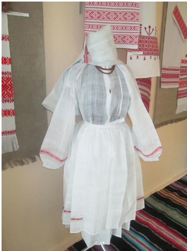
Іл. 9. Традиція серпанкового ткацтва у с. Крупове Дубровицького р-ну Рівненської обл.

Утім, користь льону – незаперечна. Попит на природні волокна цієї рослини в наш час зростає. Україна має сприятливі кліматичні умови для вирощування льону в необхідних обсягах для забезпечення внутрішнього й зовнішнього ринків. Для подальшого розвитку льонарської галузі необхідне вдосконалення та відродження промислового льонарства в Україні, а також упровадження нового економічного механізму функціонування цієї царини на основі традиційного ткацтва.