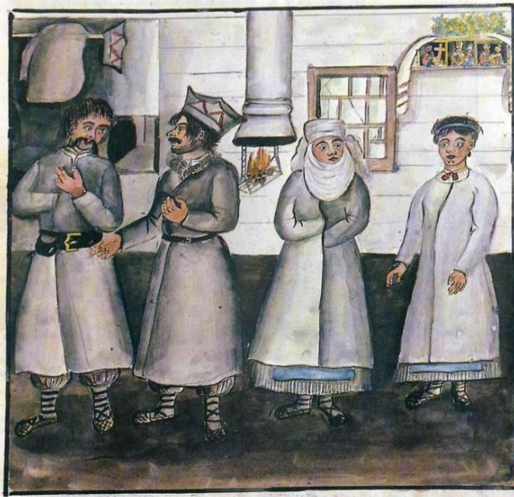
Мешканці Шенеліцького товариства

Іл. 2 в, г. Мешканці сіл різних громад Київської губернії. 1854 р. З альбому Де ля Фліза