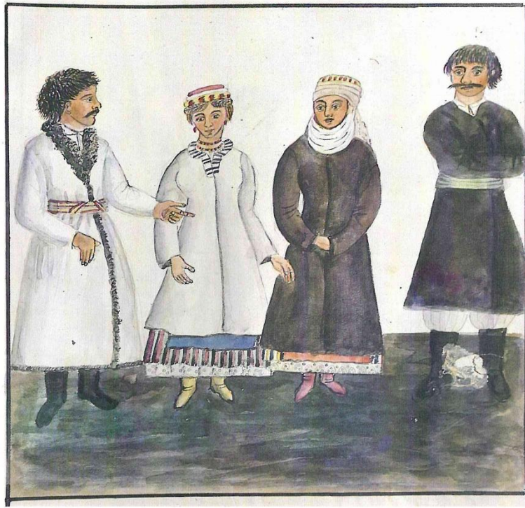
Мешканці Шпринівського та Витарівського товариств