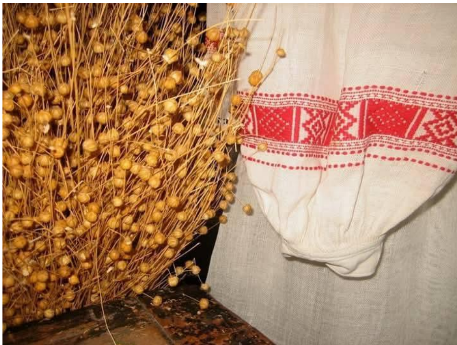
Іл. 6. Відроджений льон-«лущик». ГО «Центр дослідження і відродження Волині». м. Радивилів Рівненської обл.

На Поліссі сіяли льон-довгунець («великльон»). Однак для серпанку вибирали особливі сорти льону: «лущик» або «льон-стрибунець» – Linum crepitans (іл. 6), головки якого при дозріванні самі тріскаються, розсіваючи насіння, і льон-простяк [17, с. 36]. Це однорічні рослини, які можуть досягати 60 см у висоту. З них якраз і роблять справжній серпанок.