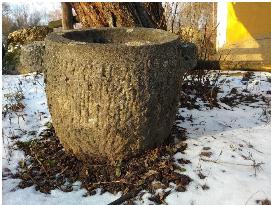
Кам'яний жолоб на садибі із с. Яришів Могилів-Подільського р-ну Вінницької обл., експозиція «Поділля» НМНАПУ