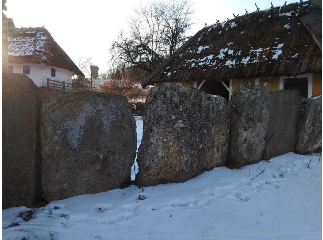
Кам'яна огорожа кін. XIX – поч. XX ст., перевезена із с. Буша Ямпільського р-ну Вінницької обл., встановлена на садибі із с. Яришів Могилів-Подільського р-ну Вінницької обл., експозиція «Поділля» НМНАПУ