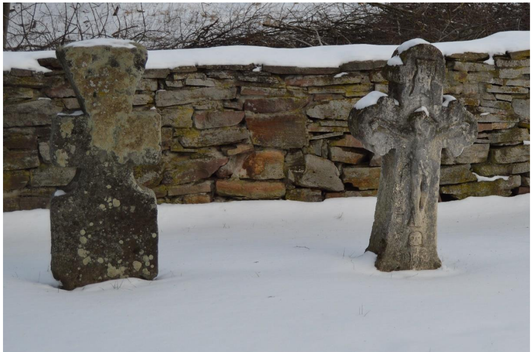
Кам'яна огорожа та надгробні хрести, встановлені на подвір'ї церкви 1817 р. із с. Зелене Гусятинського р-ну Тернопільської обл., експозиція «Поділля» НМНАПУ