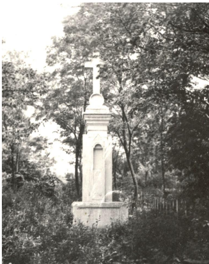
Хрест 1886 р. с. Товсте Гусятинського р-ну Тернопільської обл. Фото 1974 р.