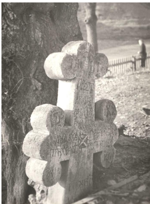
Кам'яний надгробок «Панський хрест». с. Саїнка Могилів-Подільського р-ну Вінницької обл. Фото 70–80-х рр. XX ст.