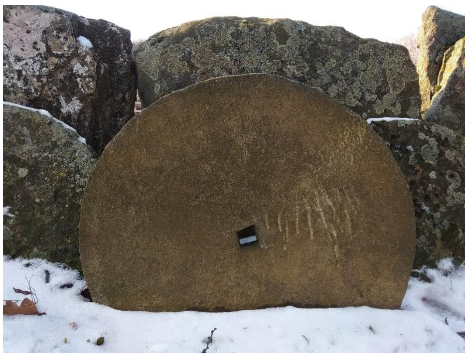
Частина кам'яних жорен на садибі із с. Яришів Могилів-Подільського р-ну Вінницької обл., експозиція «Поділля» НМНАПУ