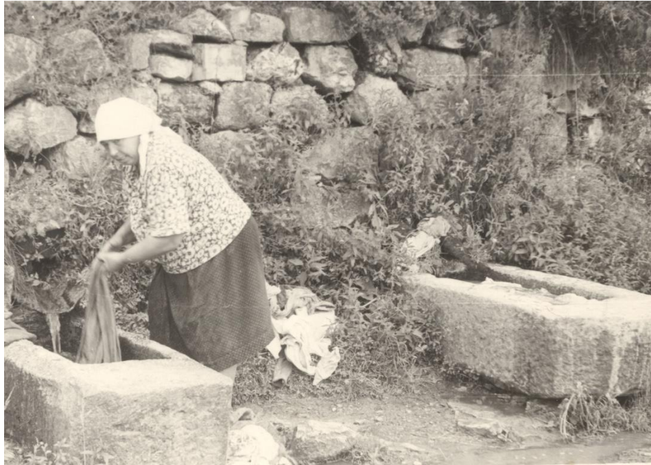
Кам'яні довбанки для прання білизни. с. Врублівці Кам'янець-Подільського р-ну Хмельницької обл. Фото 1972 р.