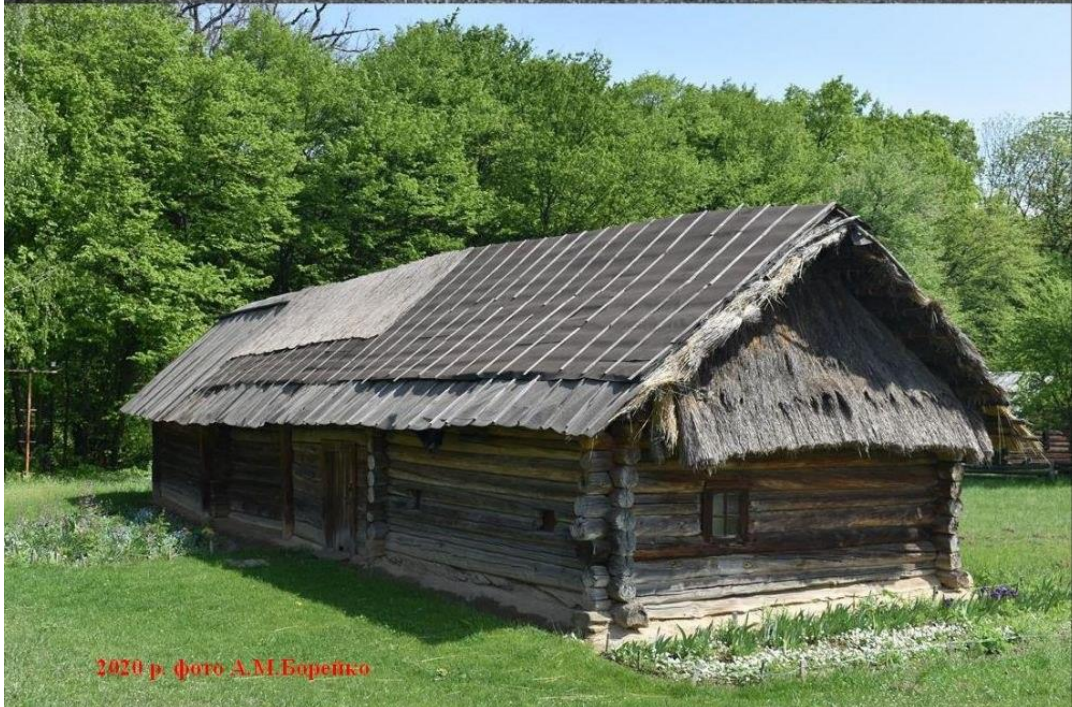
2020 р.